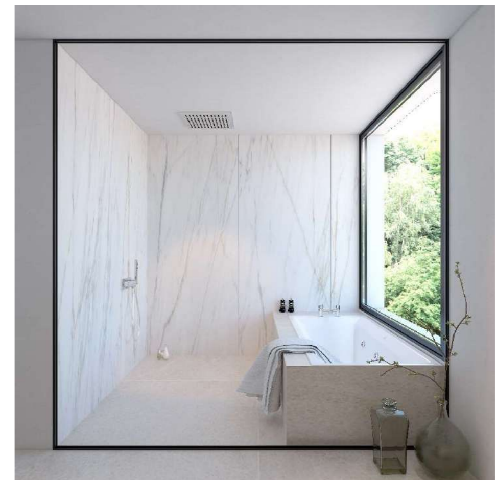
Grifería en baños secundarios