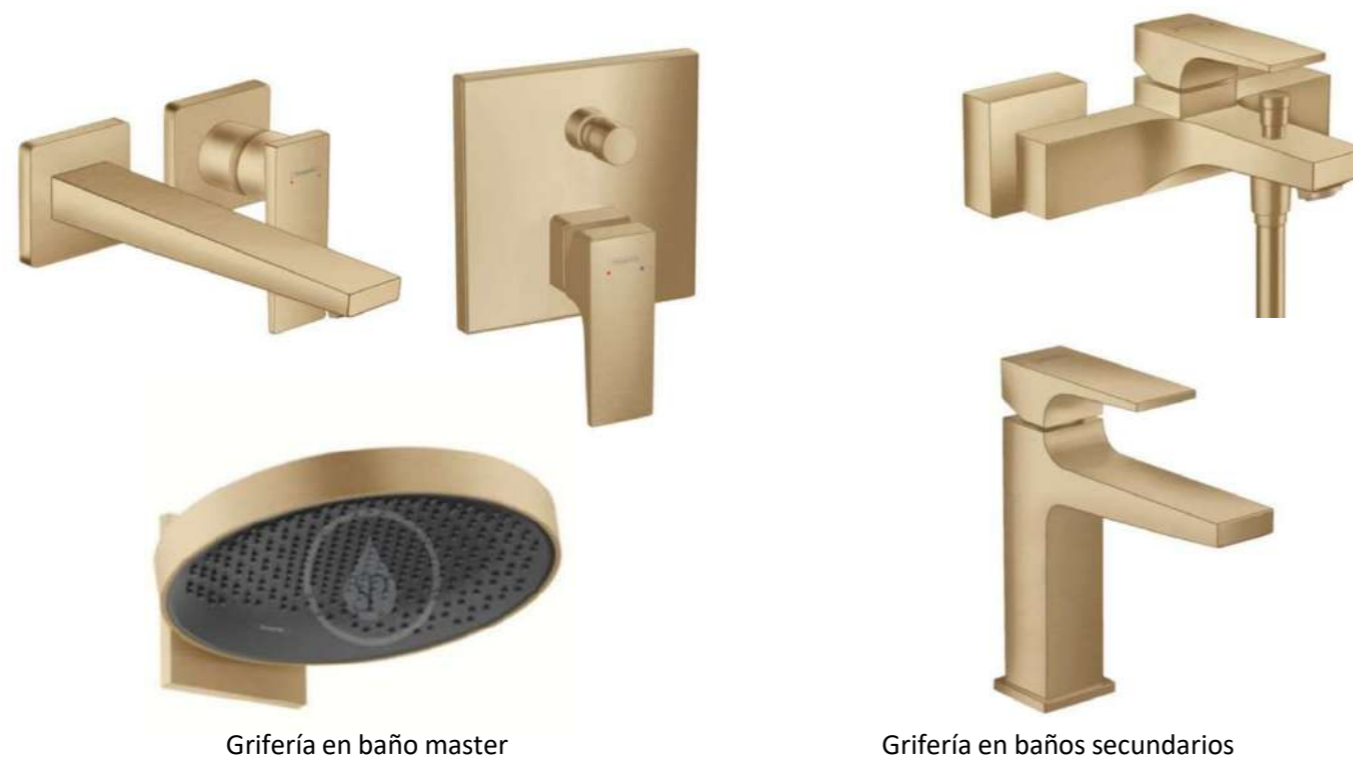
Grifería en baño master