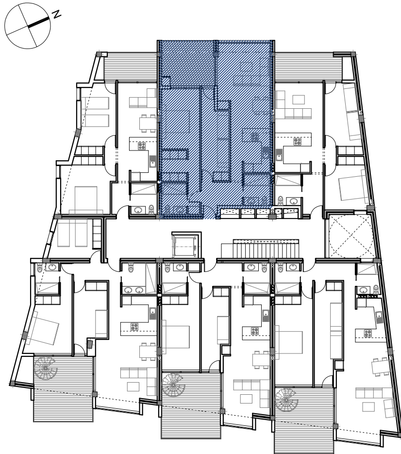
PLANTA SEGUNDA Escala 1/250

Avda. Juan Carlos I, nº10. Playa San Juan. T.M. Guía de Isora