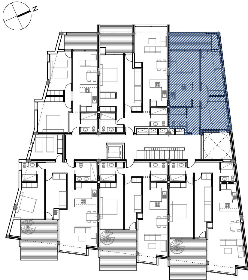
PLANTA SEGUNDA Escala 1/250

Avda. Juan Carlos I, nº10. Playa San Juan. T.M. Guía de Isora